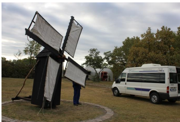
A vitorlavásznak felkerülnek a vitorlákra.