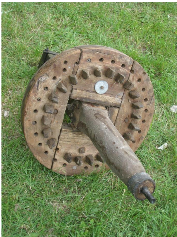
A kiemelt szelestengely a széleskerékkal.