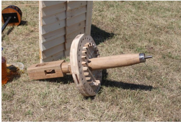
Az új szelestenhely.