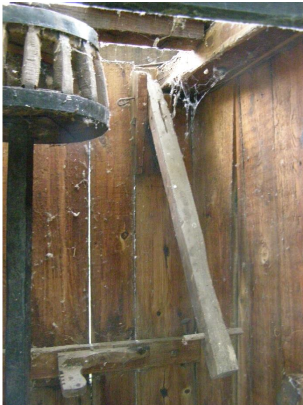
A sérült fékszalag és fékkar.