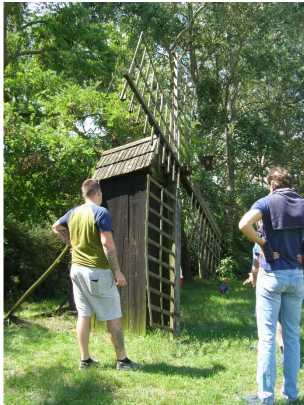
A megmentésre váró tanyai széldaráló.