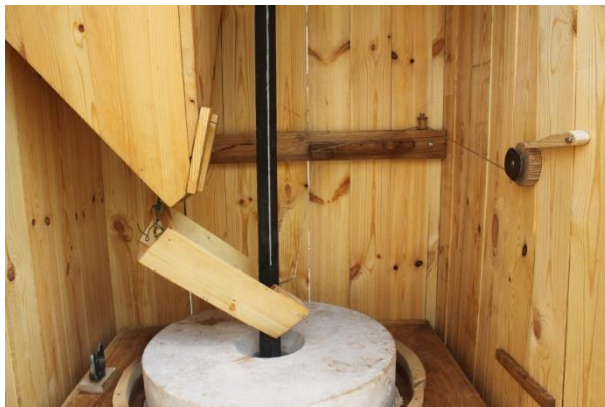
Az elkészült belső rész.