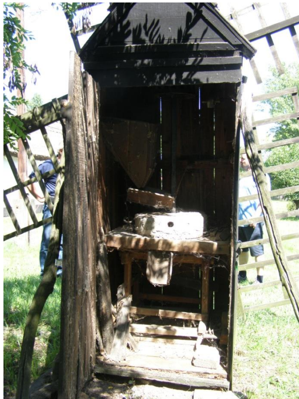
A siralmas belső.